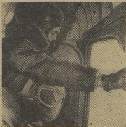
Ещё мгновение — и небо, такое синее-синее, о котором мечтал с самого детства, обнимет курсанта Берегового...

Ю. ЗАЙЦЕВ, научный сотрудник Института космических исследований АН СССР.